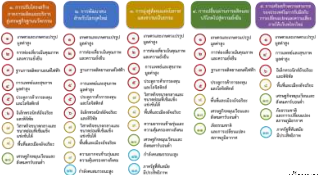
เป้าหมายการพัฒนา...

ความเชื่อมโยงระหว่างหมวดหมู่การพัฒนา กับเป้าหมายหลักแสดงไว้ในแผนภาพที่ ๓.๑ โดยหมวดหมู่การพัฒนาที่กำหนดขึ้นเป็นประเด็นที่มีลักษณะเชิงบูรณาการที่ครอบคลุมการพัฒนาตั้งแต่ในระดับต้นน้ำจนถึงปลายน้ำ และสามารถนำไปสู่ผลพัฒนาทั้งในมิติเศรษฐกิจ สังคม ทรัพยากรธรรมชาติและสิ่งแวดล้อมไปพร้อม ๆ กัน ทำให้หมวดหมู่แต่ละประการสามารถสนับสนุนเป้าหมายหลักได้มากกว่าหนึ่งข้อ นอกจากนี้ การพัฒนาภายใต้แต่ละหมวดหมู่ไม่ได้แยกขาดจากกัน แต่มีการสนับสนุนหรือเอื้อประโยชน์ซึ่งกันและกัน